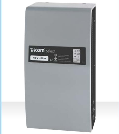
Ladegerät TriCOM select, Gehäusetyp WT 20