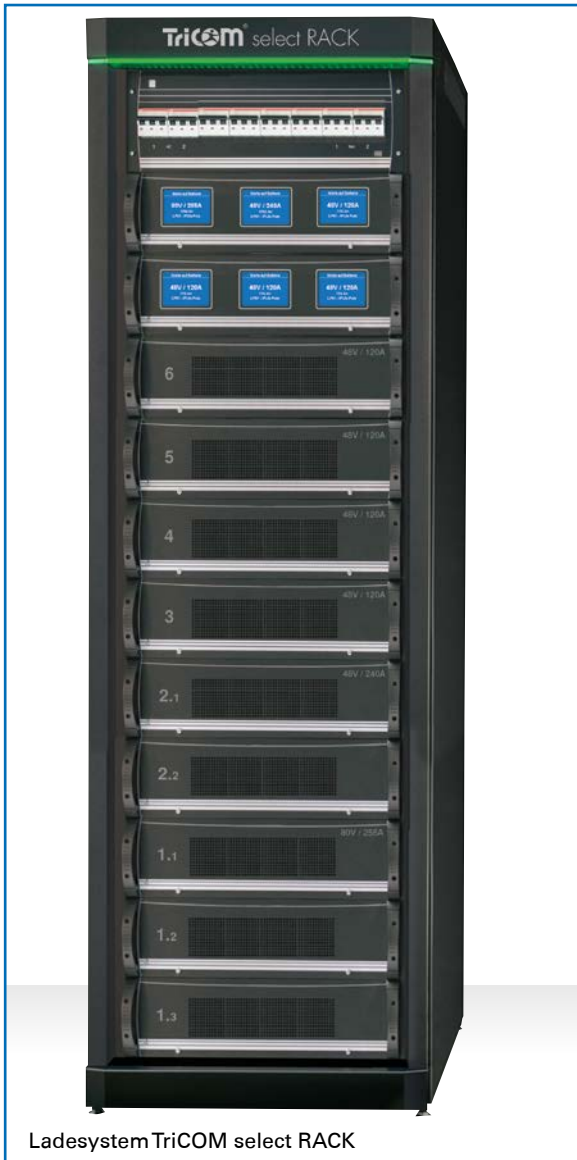
Ladesystem TriCOM select RACK