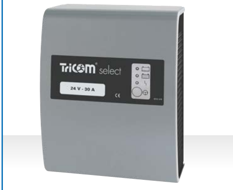
Ladegerät TriCOM select, Gehäusetyp WT 17